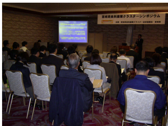
平成 19 年度食料産業クラスターシンポジウム