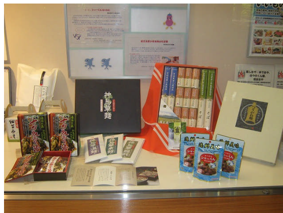
平成 19 年度の開発商品

秋に商品開発の中間報告会、そして年度末に商品開発総合評価を行う。また、次年度の取組みについて新商品開