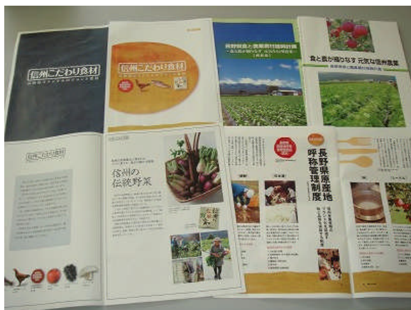
長野県農政部の取り扱う様々な取組みパンフレット

信州オリジナル食材の取組みに先立ち、2002年に長野県原産地呼称管理制度を設けている。この制度では、従来の大きさ、色、形などではなく、栽培方法や、生産方法、味に価値を置き、「長野県で生産・製造されたもの」として責任を持って消費者にアピールできるものを認定している。現在の対象は、日本酒、焼酎、米、ワイン、シードルの5品目で、認定された商品には認定マークと生産情報が表示される。