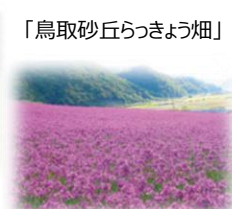
「鳥取砂丘らっきょう畑」