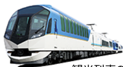
観光列車の例：「観光特急しまかせ」

日本各地を走る観光列車。 「食」を楽しむ列車では、食堂車や車内販売ではGI産品の提供を。 「景観」を楽しむ列車では、車窓から、あるいはや途中下車で産地を探訪。