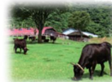
「但馬牧場公園」 (但馬牛博物館併設)

GIを育んだ地域の豊かな自然や深い歴史に触れるスポットを提案。訪れた人は、「逸品」の価値を肌で実感。