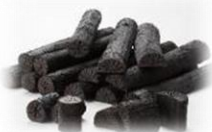
「岩手木炭(炭焼き体験)」

実際に産地を訪れ、GIを郷土料理として楽しむほか、収穫・ものづくり等の体験を通じて産地の物語を聞く機会も。